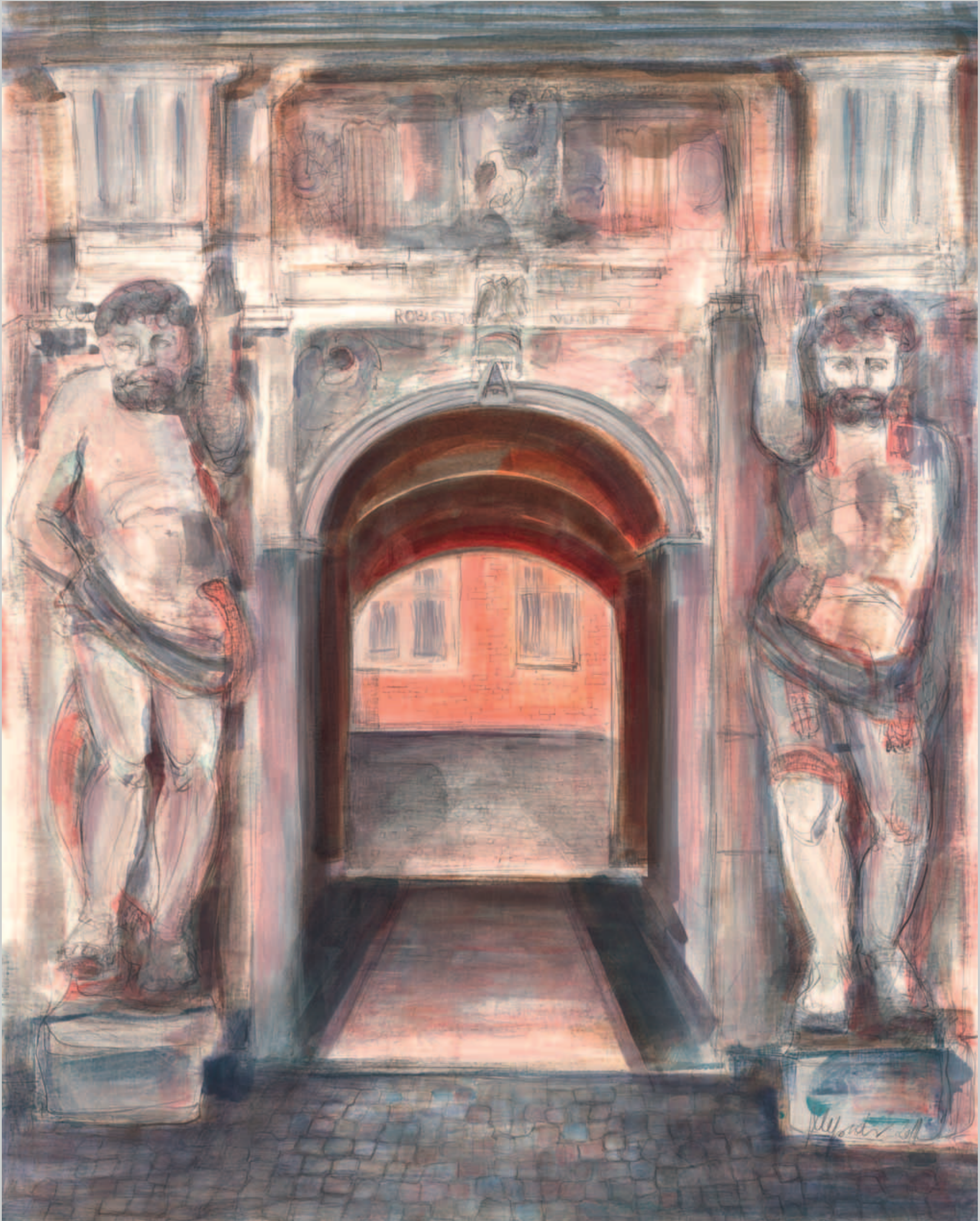
Portal des „Riesenhauses“ Mischtechnik · 2011 · 62 x 50 cm