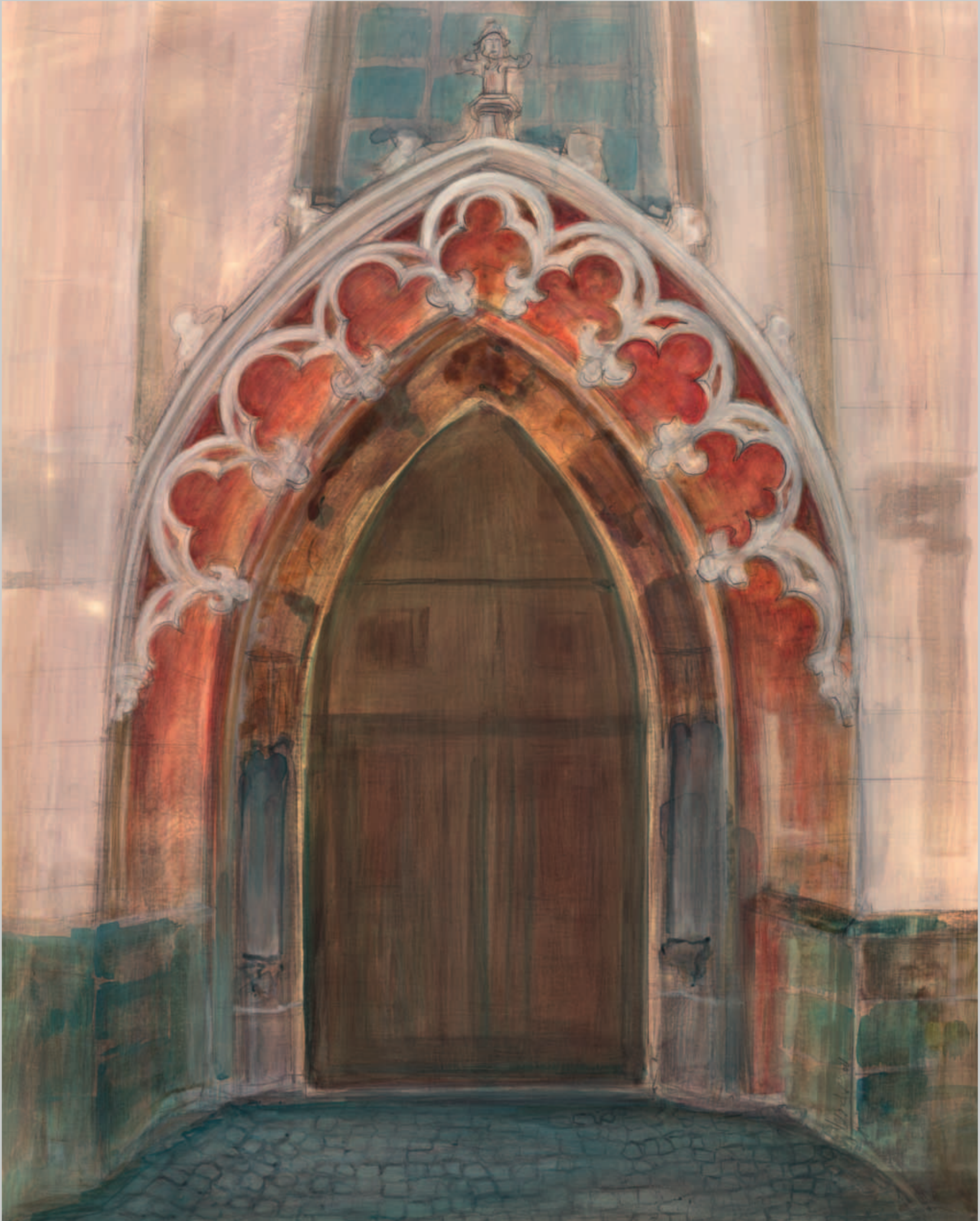
Hallenportal der Moritzkirche Mischtechnik · 2011 · 62 x 50 cm