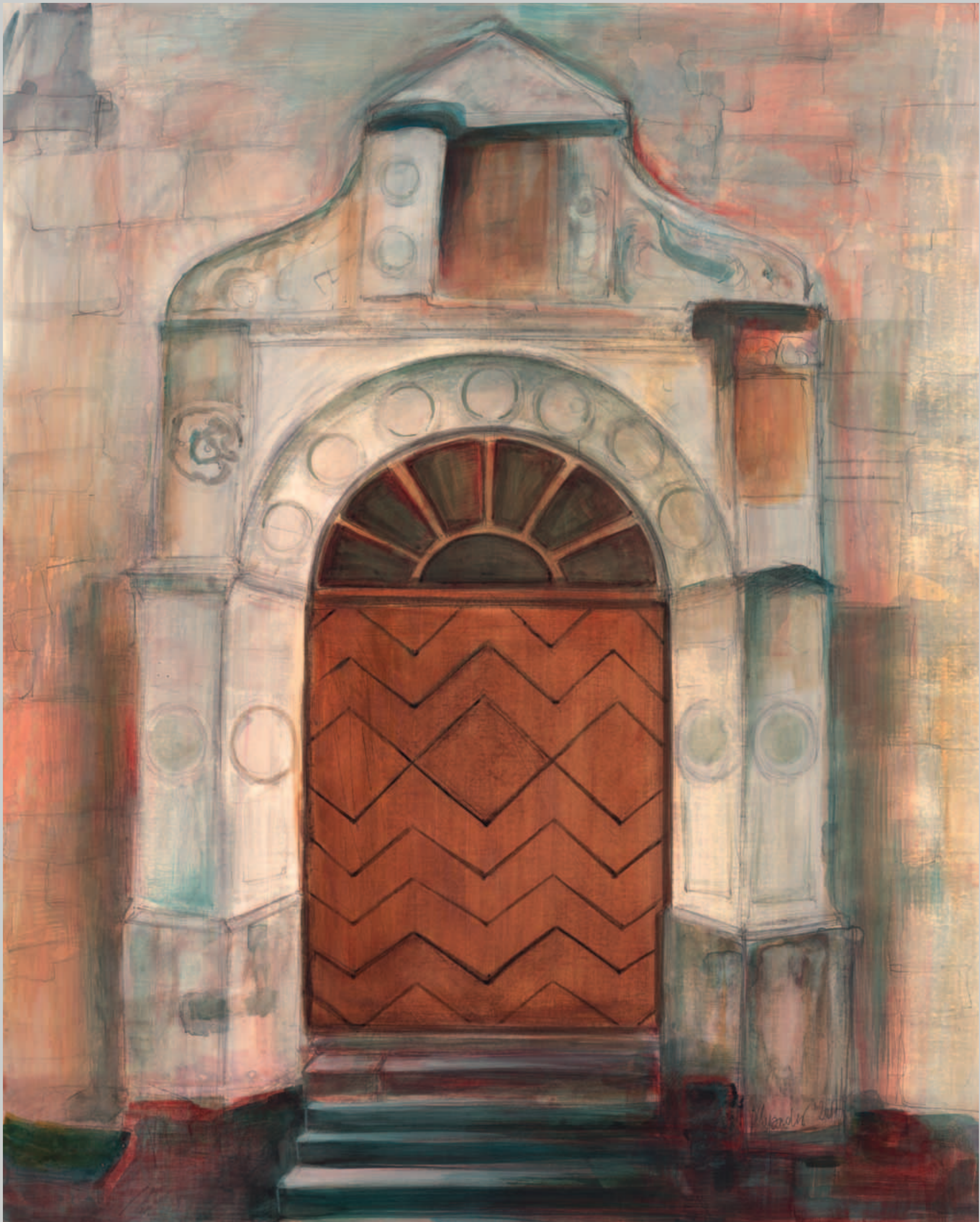
Portal am Kühlen Brunnen Mischtechnik · 2011 · 62 x 50 cm