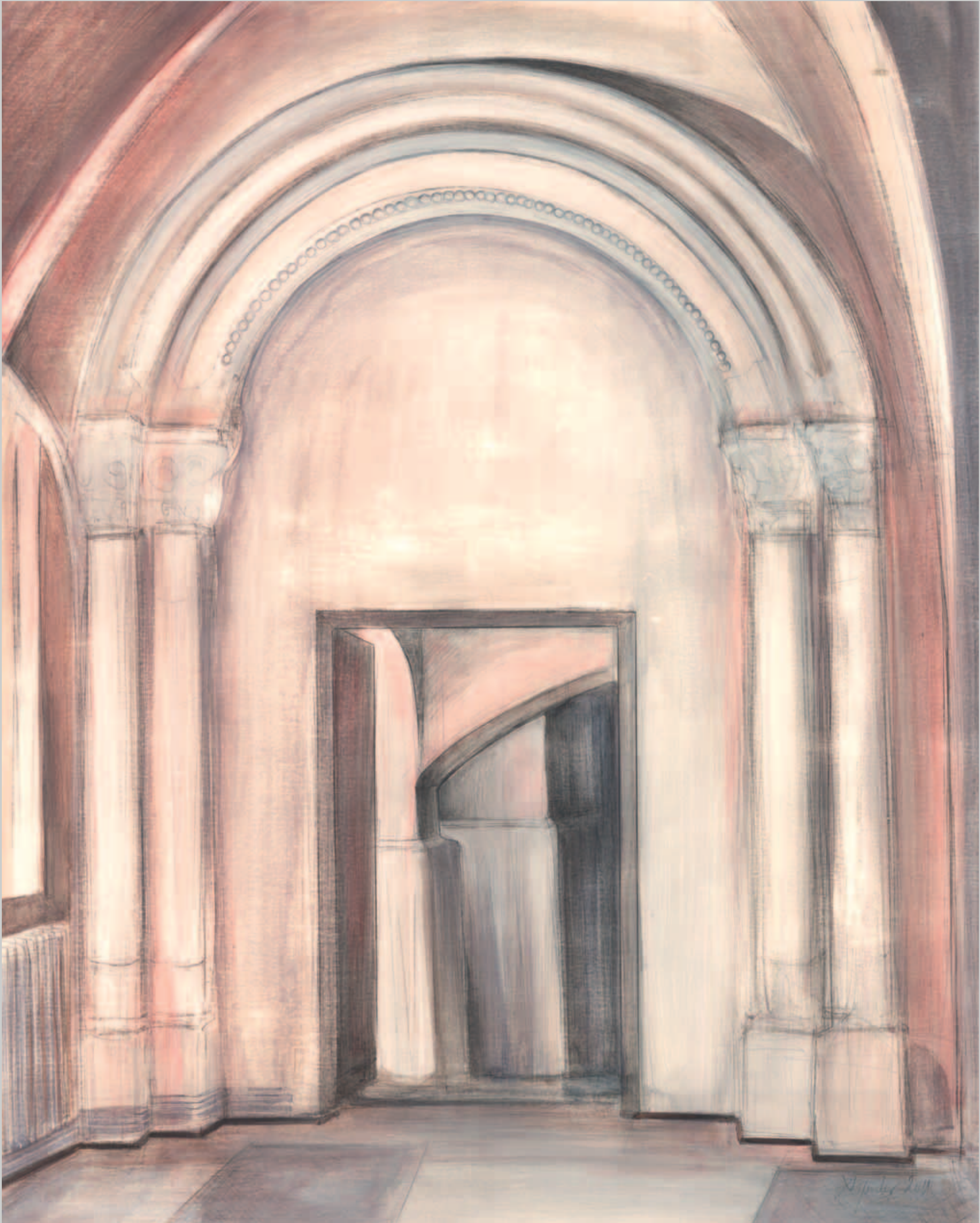
Portal des Klosters Neuwerk Mischtechnik · 2011 · 62 x 50 cm