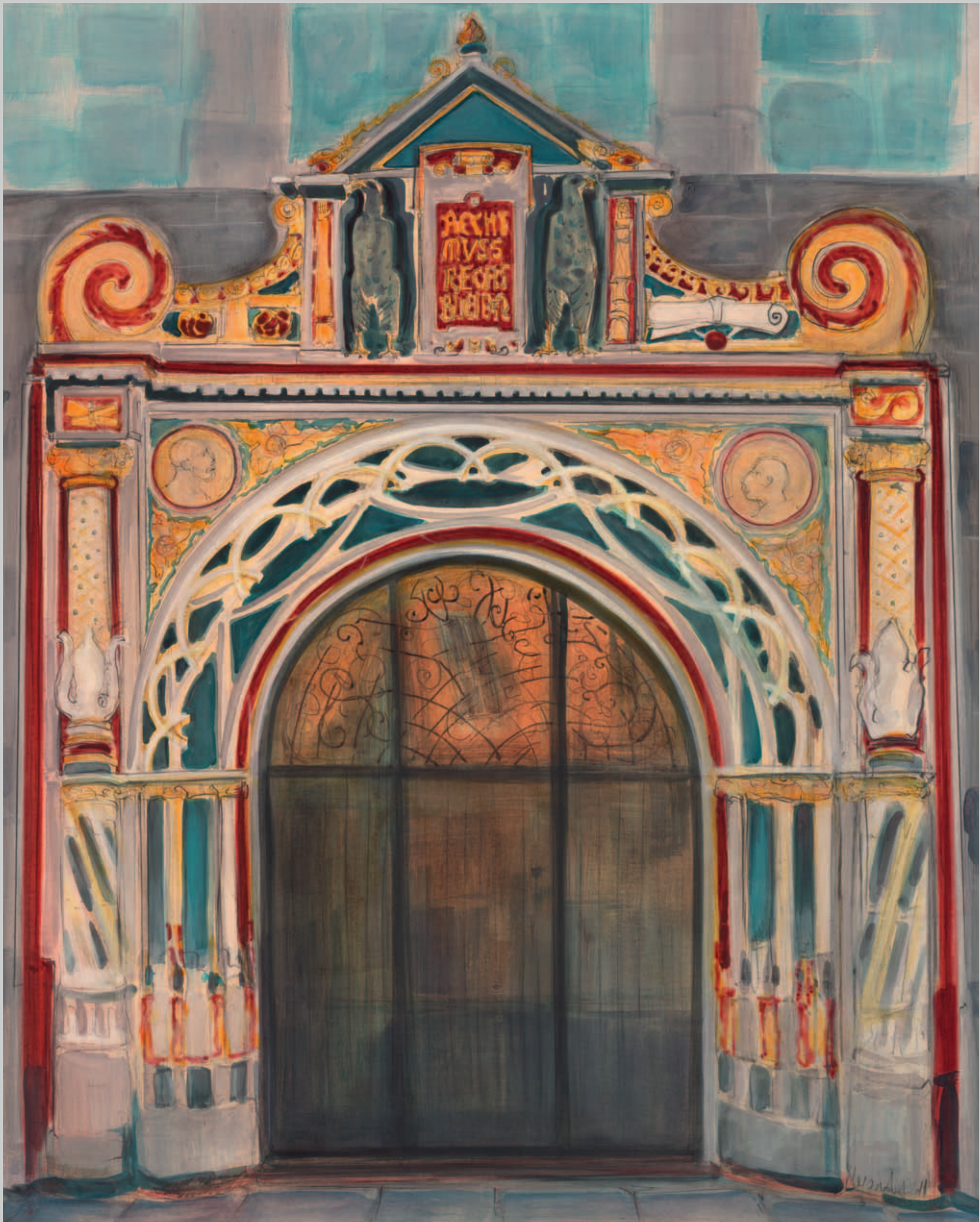
Portal des Landesgerichtes Mischtechnik · 2011 · 62 x 50 cm