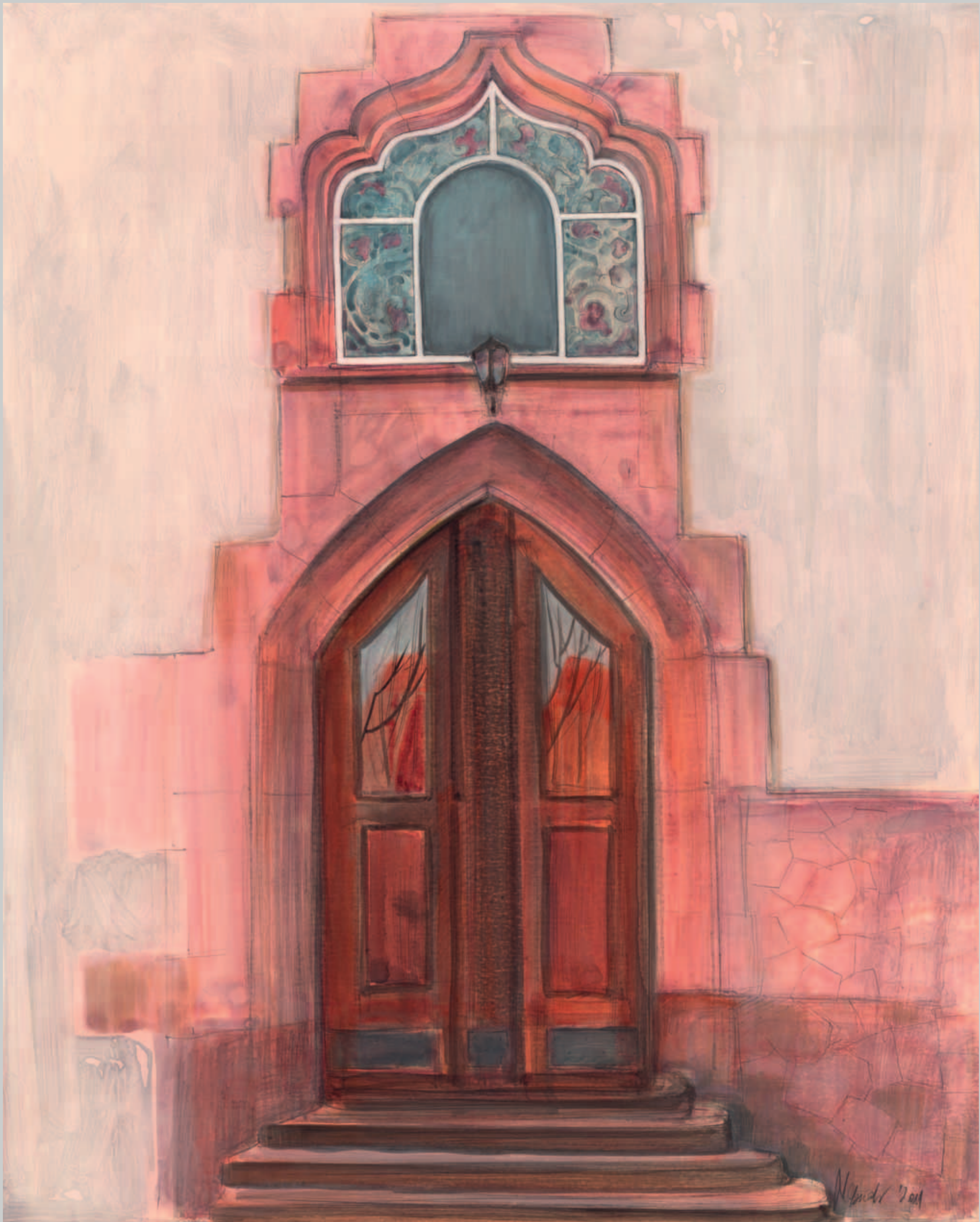
Jugendstilportal Robert-Franz-Ring 12 Mischtechnik · 2011 · 62 x 50 cm