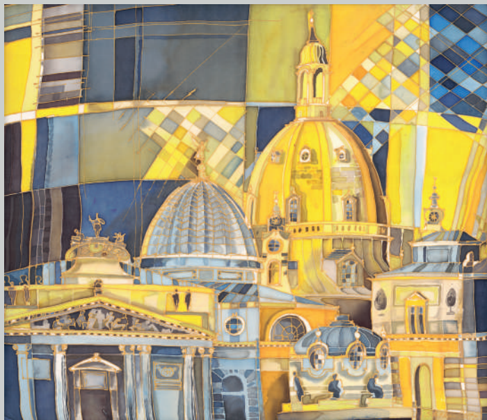
Brühlsche Terrasse, Dresden