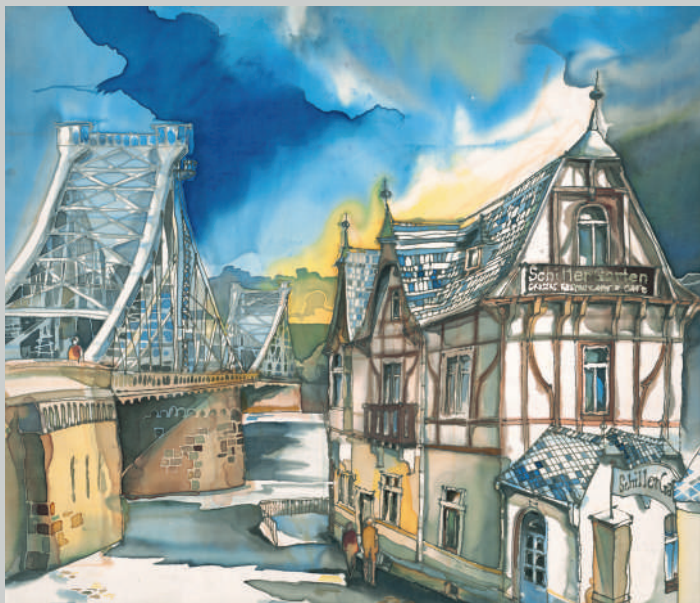
Blaues Wunder, Dresden