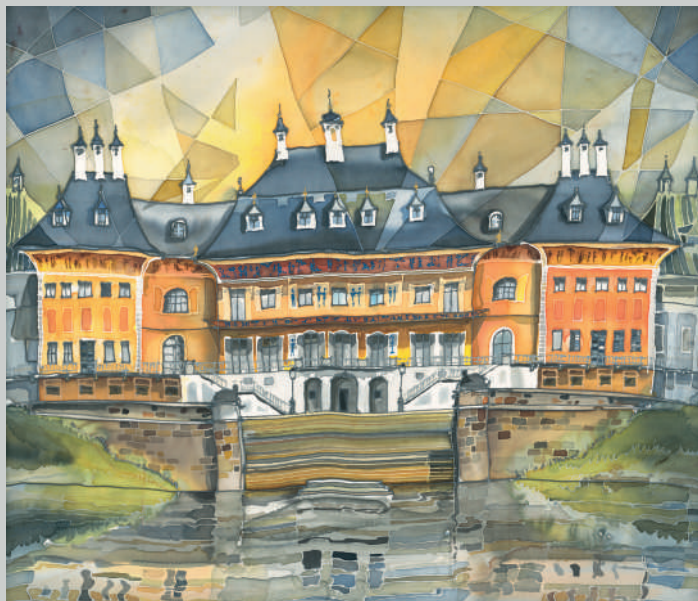
Schloss Pillnitz, Dresden