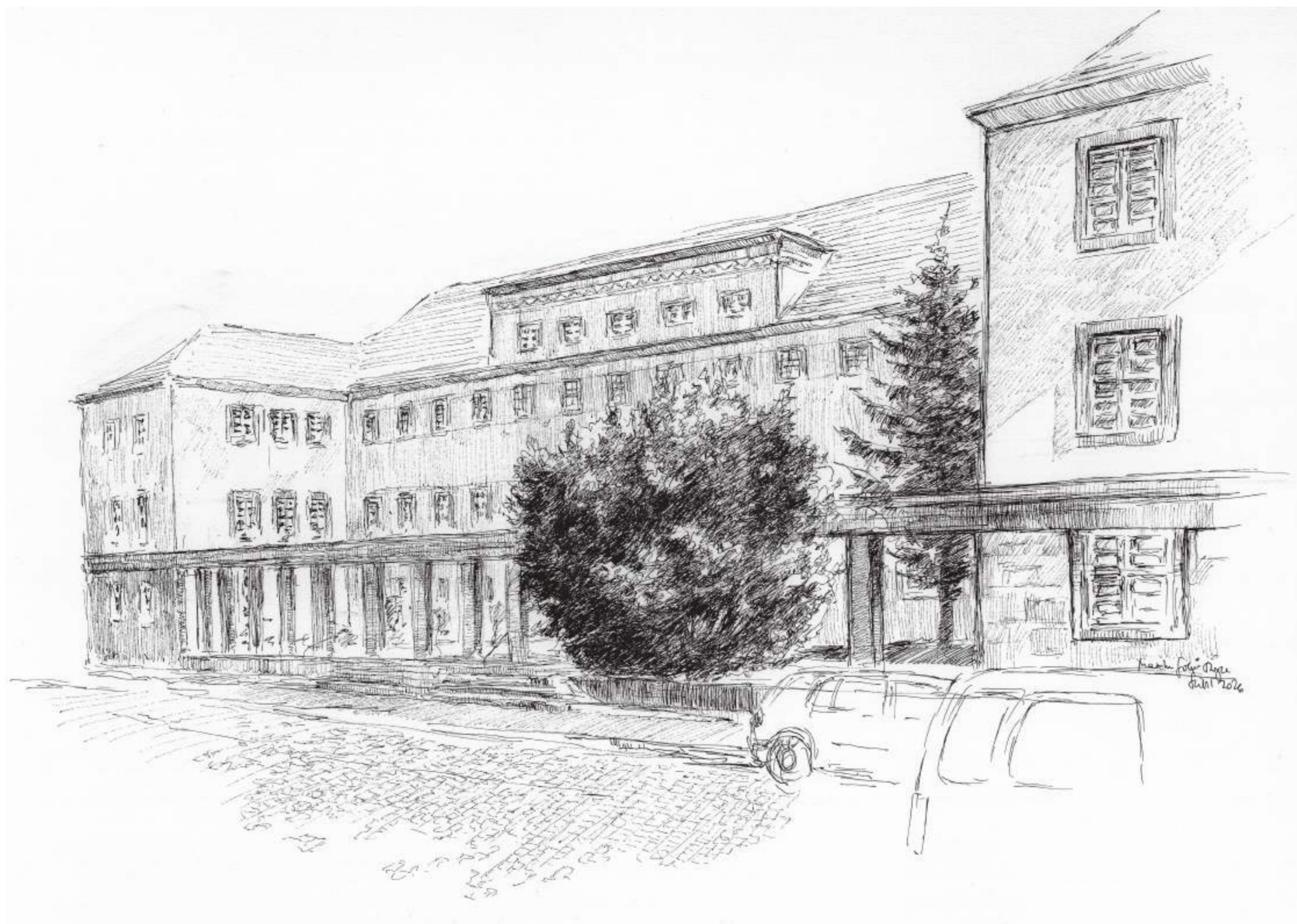
Maxim-Gorki-Straße, Halle (Saale) • Tuschezeichnung • 2026 • 30 x 42 cm