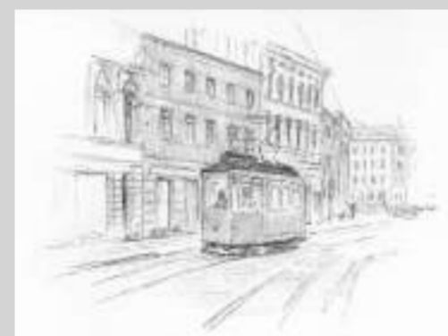
Straßenbahn in der Mansfelder Str.