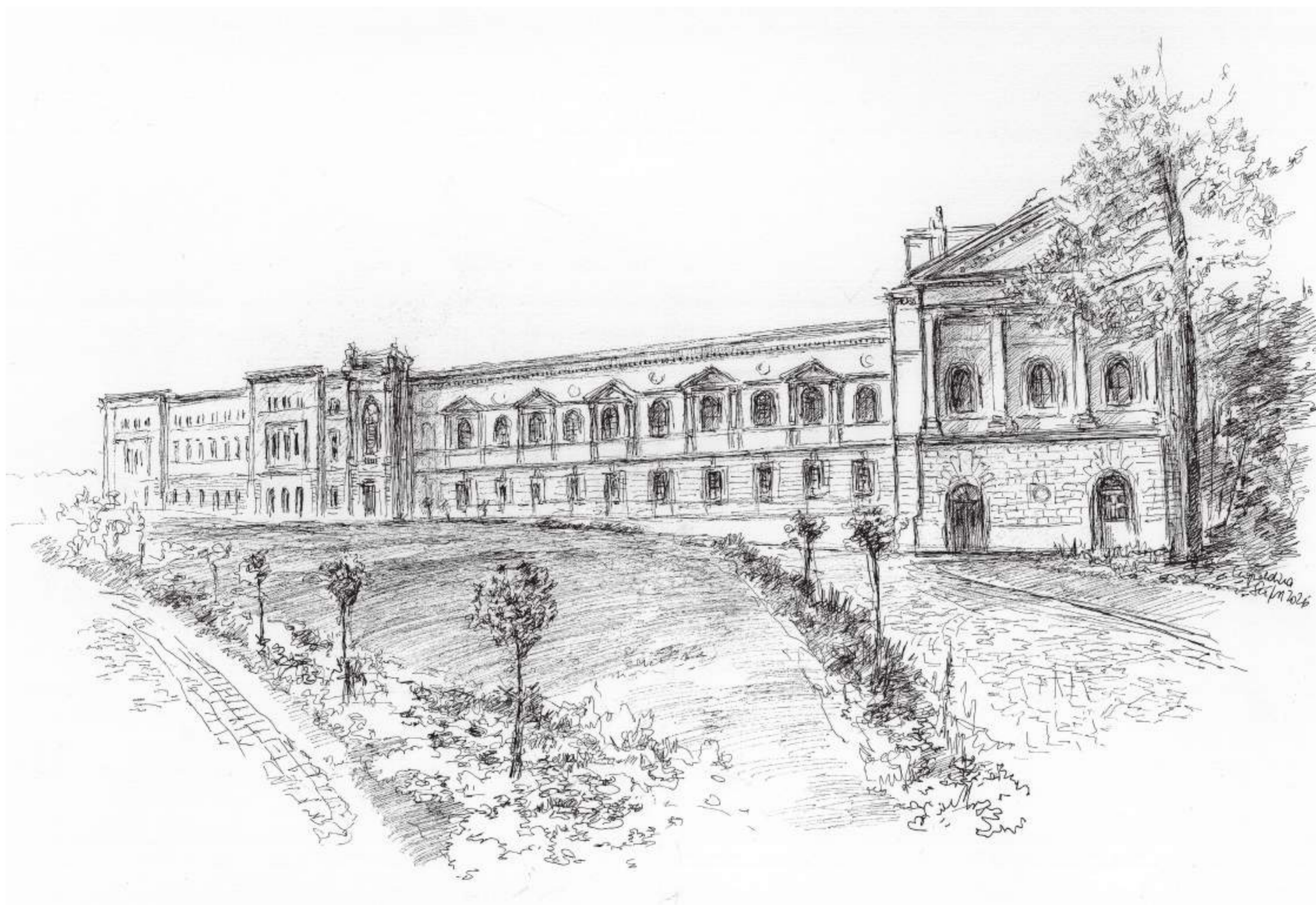
Leopoldina, Halle (Saale) • Tuschezeichnung • 2026 • 30 x 42 cm