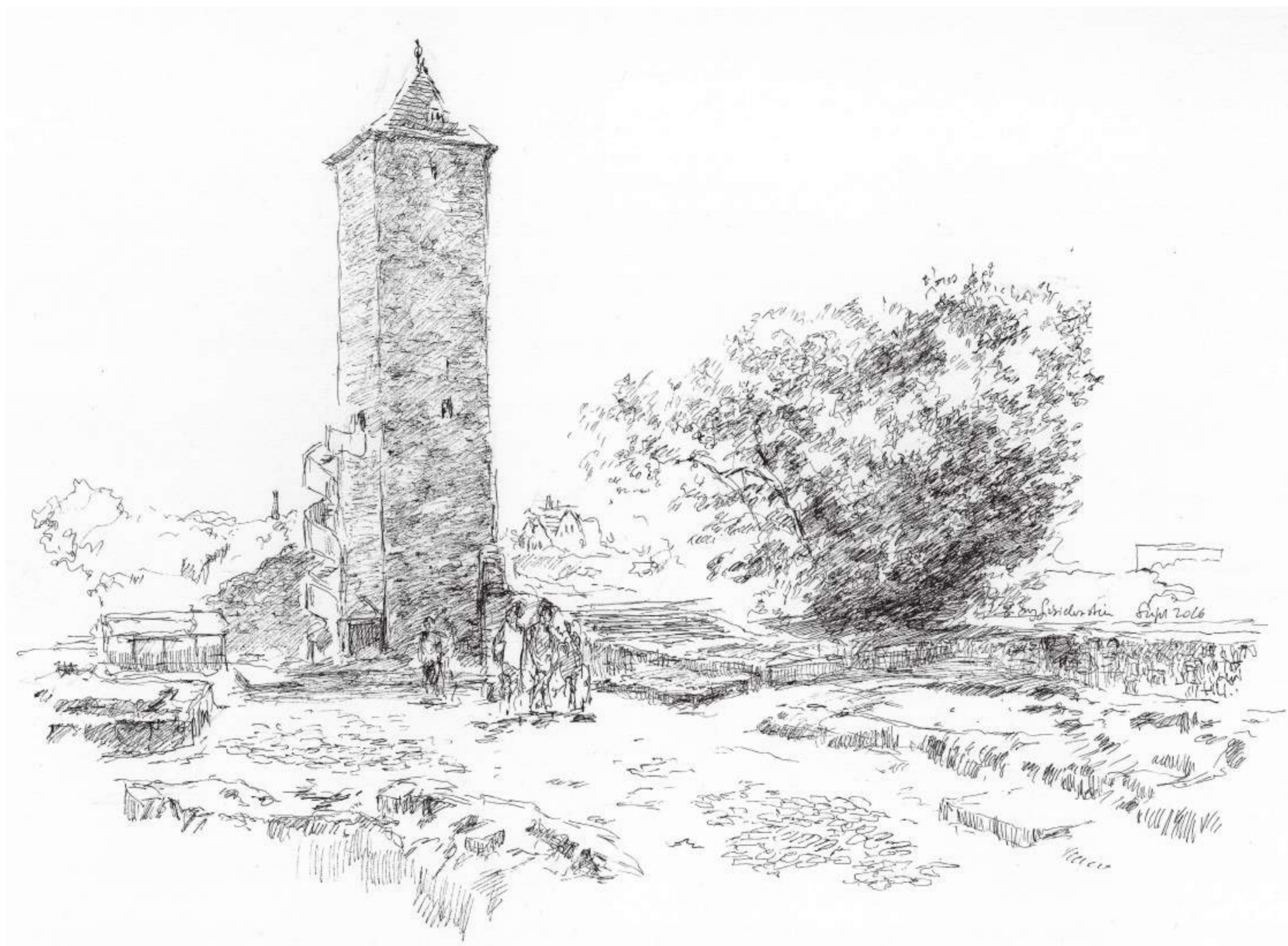
Burg Giebichenstein, Halle (Saale) • Tuschezeichnung • 2026 • 30 x 42 cm