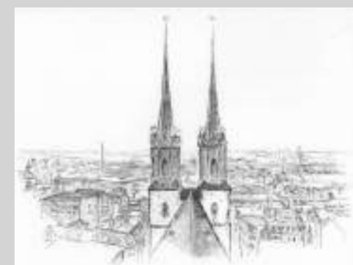
Blick in den Westen Halles (und Deckblatt)