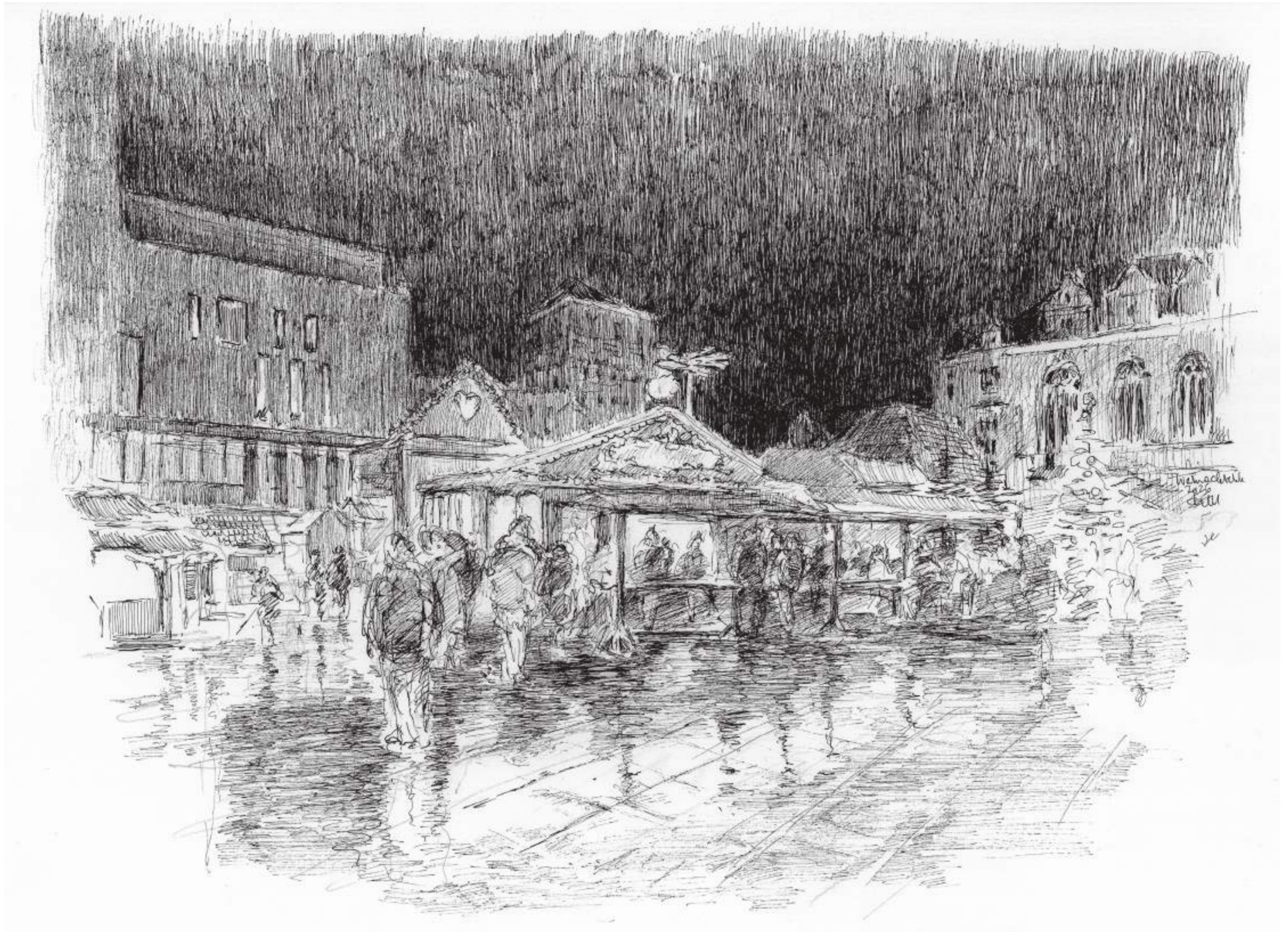
Weihnachtsmarkt, Halle (Saale) • Tuschezeichnung • 2026 • 30 x 42 cm