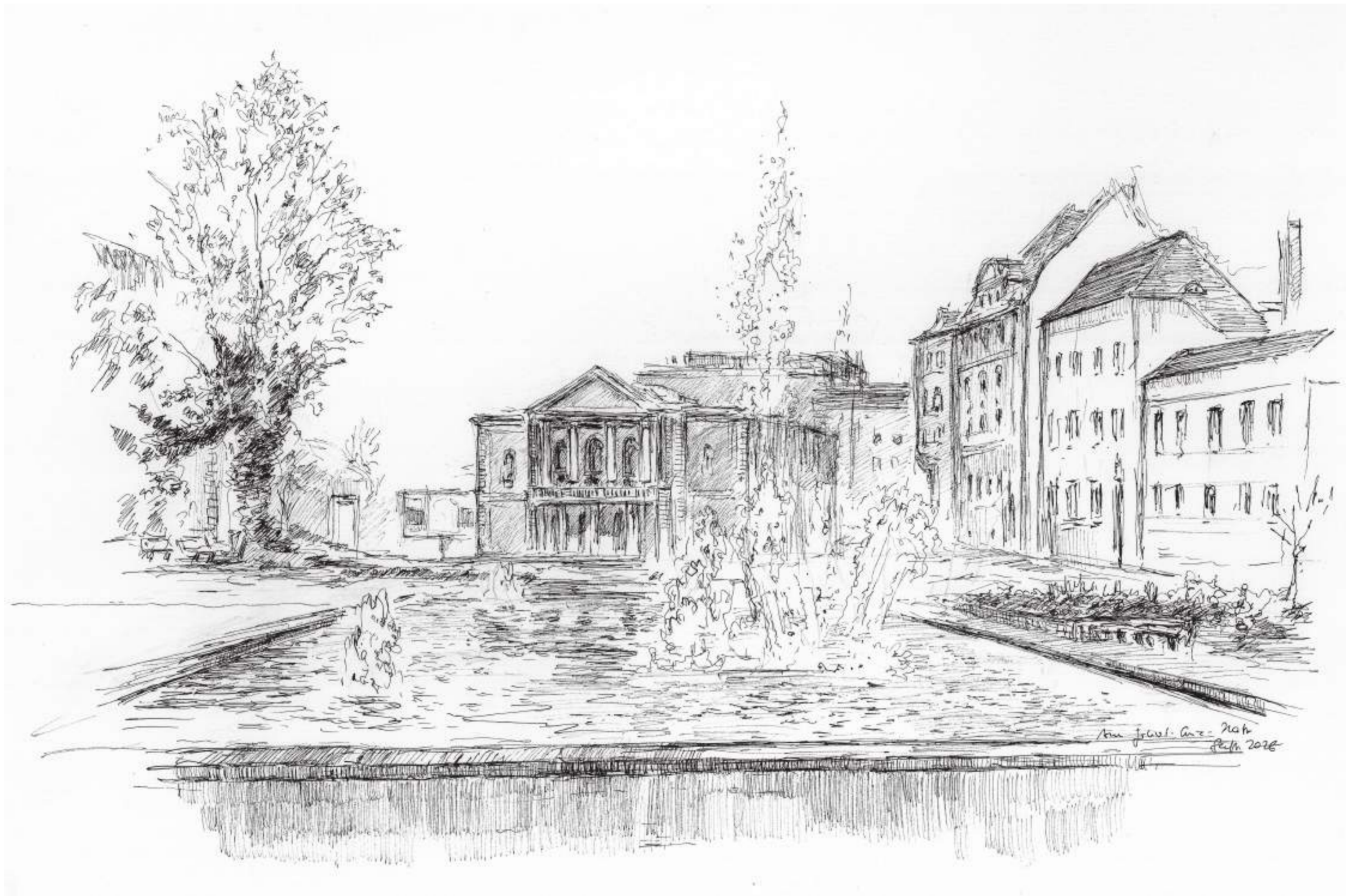
Am Juliot-Curie-Platz, Halle (Saale) • Tuschezeichnung • 2026 • 30 x 42 cm