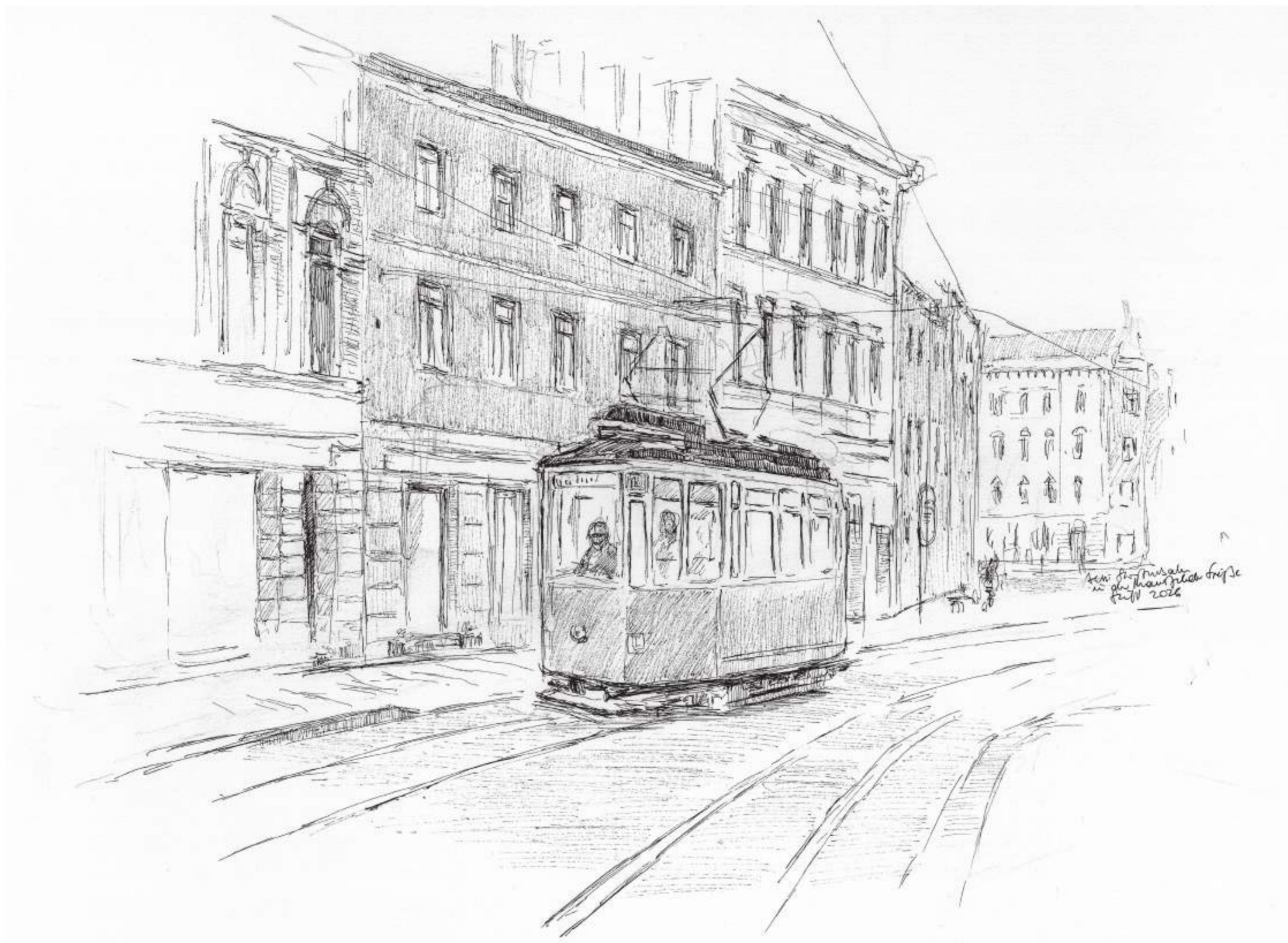
Straßenbahn in der Mansfelder Straße, Halle (Saale) • Tuschezeichnung • 2026 • 30 x 42 cm