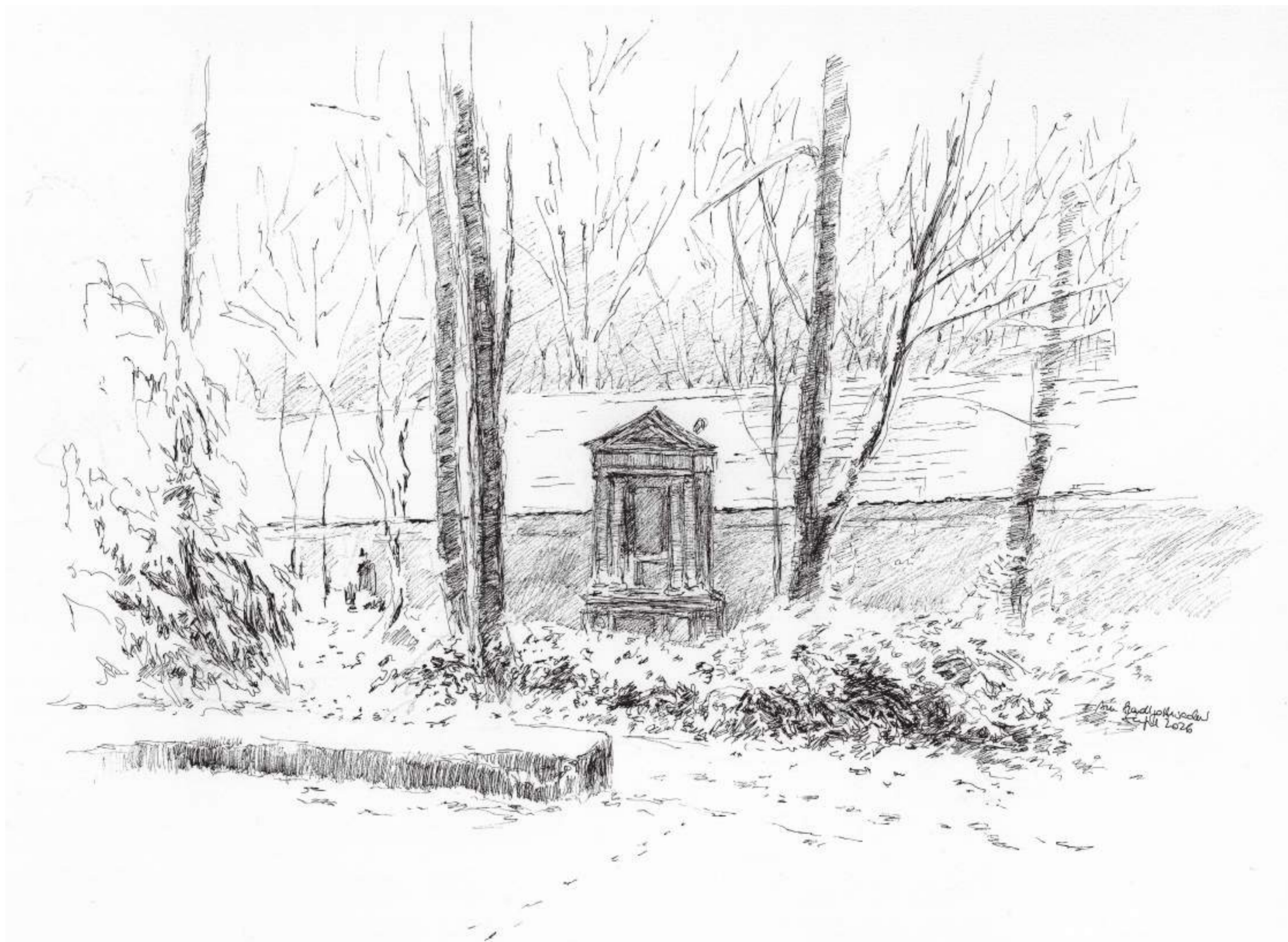
Am Stadtgottesacker, Halle (Saale) • Tuschezeichnung • 2026 • 30 x 42 cm