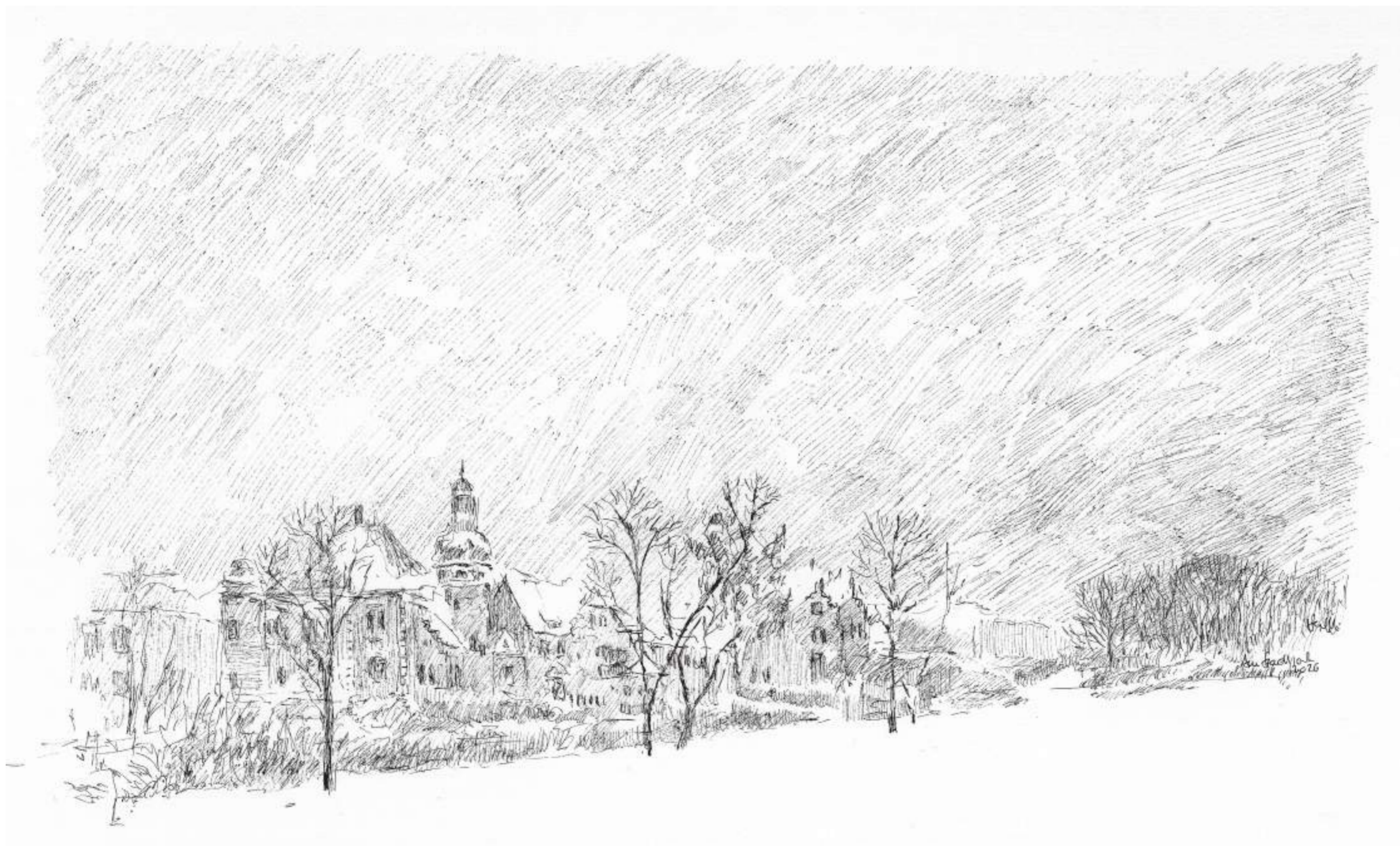
Am Stadtpark, Halle (Saale) • Tuschezeichnung • 2026 • 30 x 42 cm