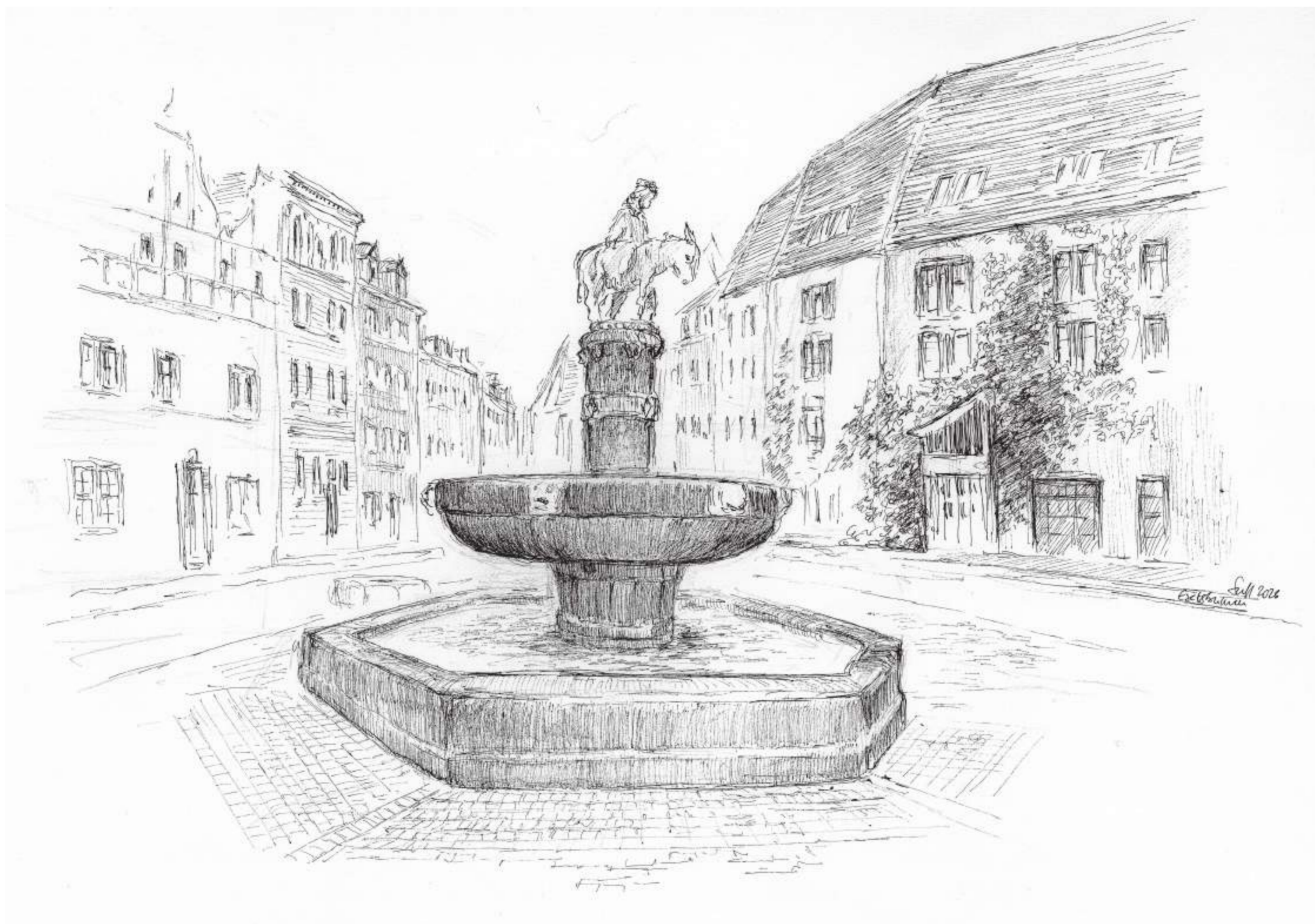
Eselsbrunnen, Halle (Saale) • Tuschezeichnung • 2026 • 30 x 42 cm