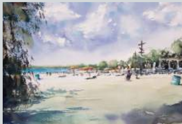
Nordstrand Cospudener See