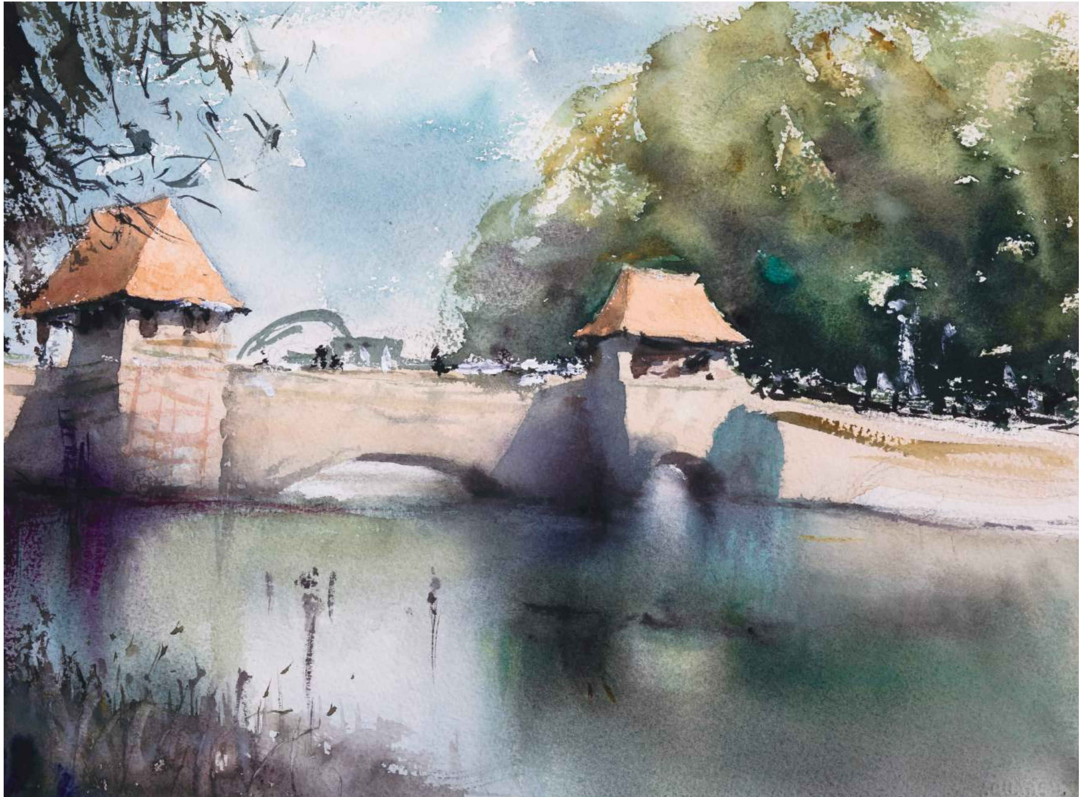
Palmgarten, Leipzig • 2025 • Aquarell • 30 x 40 cm