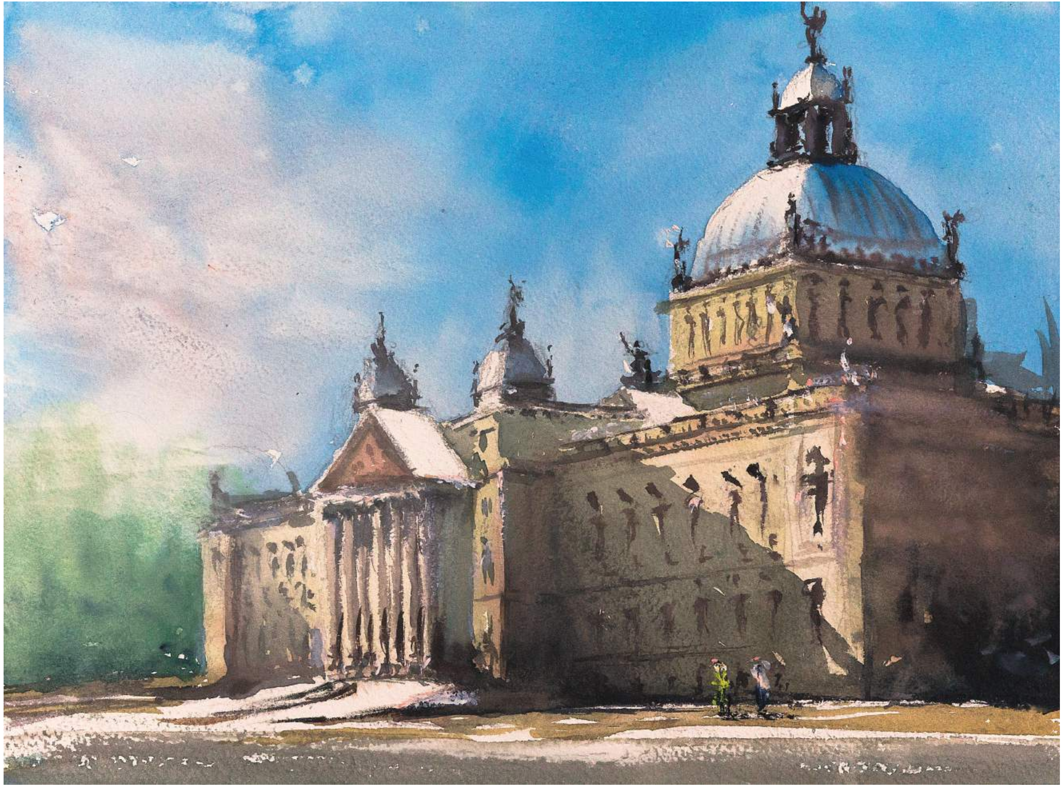
Bundesverwaltungsgericht, Leipzig • 2024 • Aquarell • 30 x 40 cm