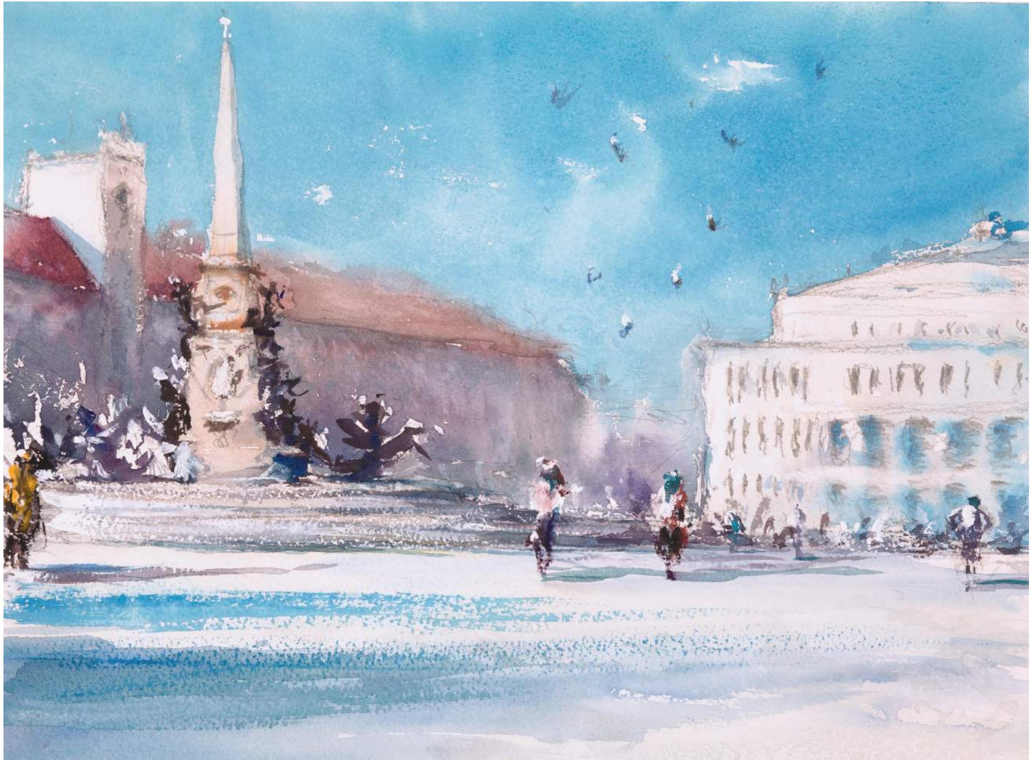
Augustusplatz, Leipzig • 2025 • Aquarell • 30 x 40 cm