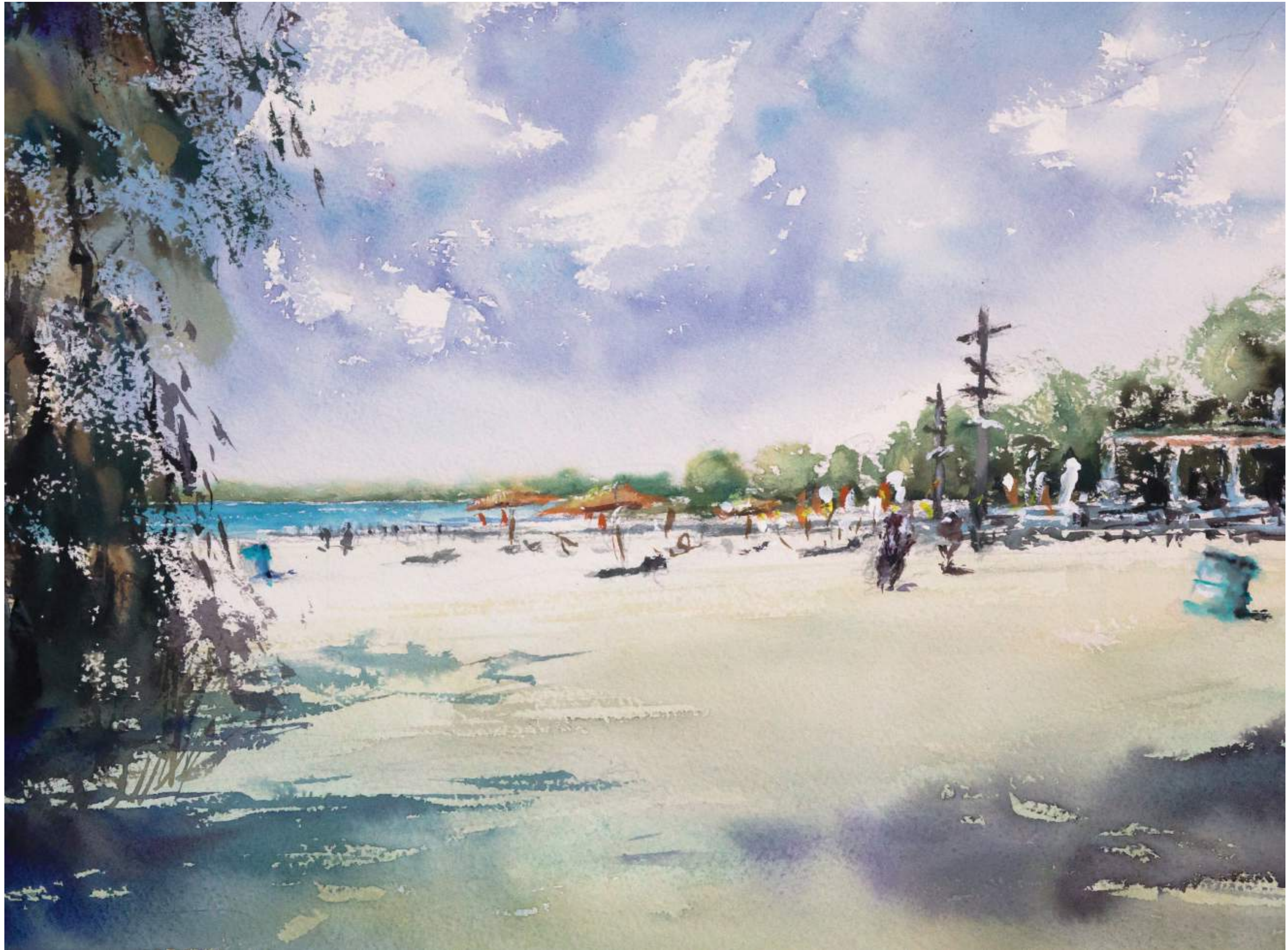
Nordstrand Cospudener See, Leipzig • 2025 • Aquarell • 30 x 40 cm