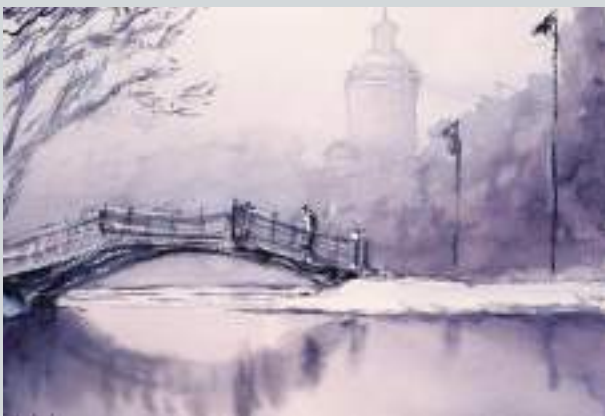
Clara-Zetkin-Park mit Pleißenburg