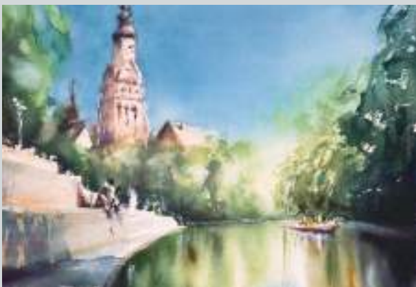
Entensteg am Kanal