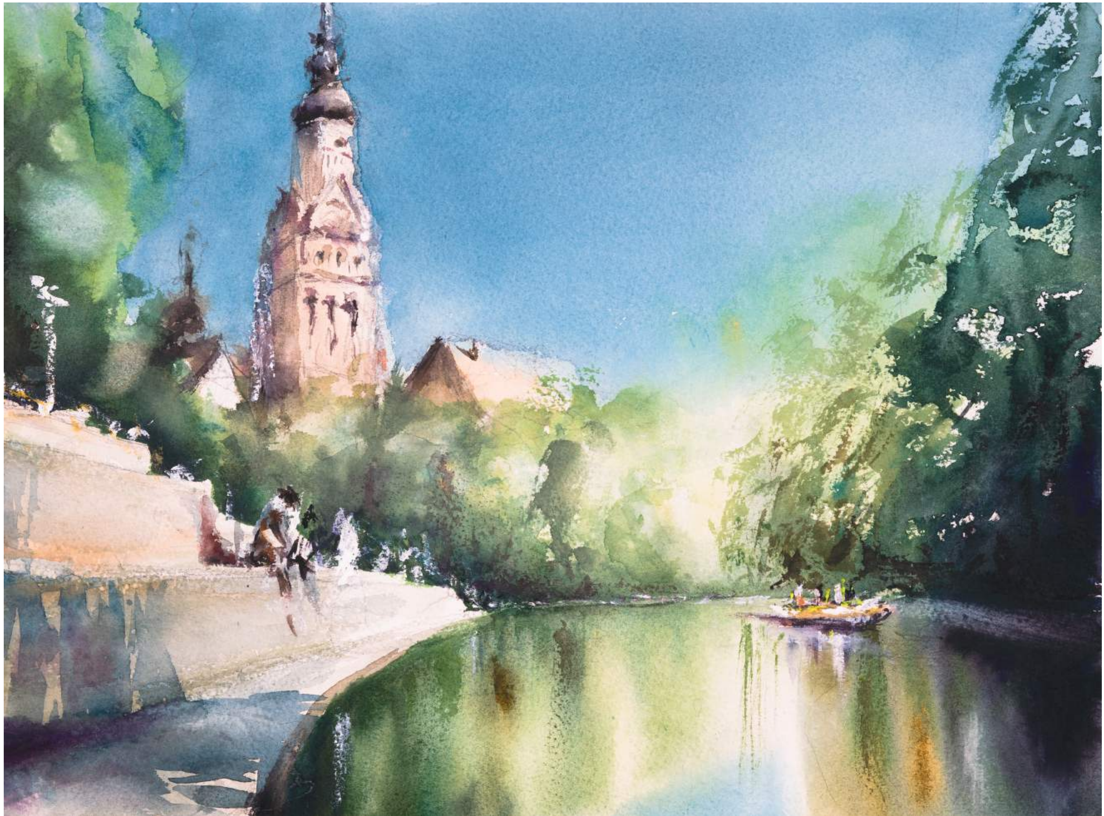
Entensteg am Kanal, Leipzig • 2025 • Aquarell • 30 x 40 cm